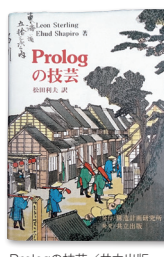
Prologの技芸 / 共立出版

論理的推論と確率的推論を同時に行えるプログラミング言語の研究をより深く進めたいと、この世界に入った亀谷先生。複雑になりがちなAI技術だからこそ、アイデアはつねにシンプルな方向に発展させるよう気を付けているそうです。