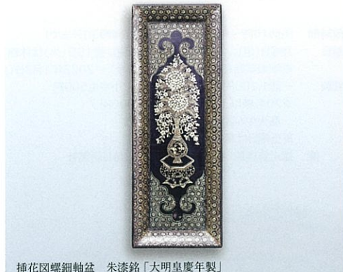
挿花図螺鈿軸盆 朱漆銘「大明皇徳年製」