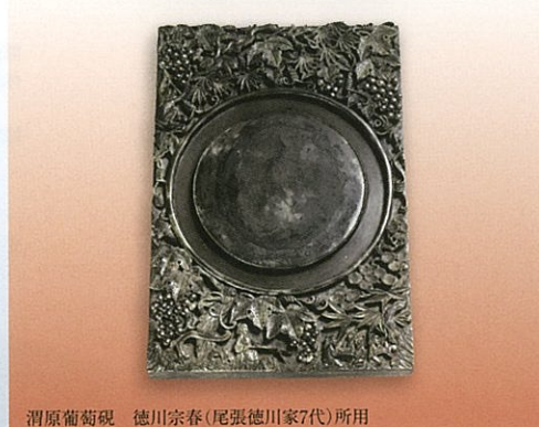
渭原葡萄硯 徳川宗春(尾張徳川家7代)所用