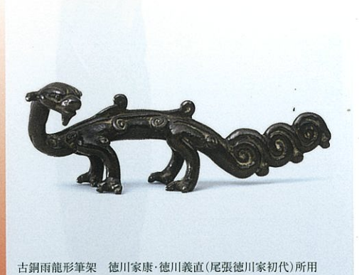
古銅雨龍形筆架 徳川家康・徳川義直(尾張徳川家初代)所用