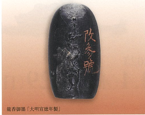
龍香御墨「大明宣徳年製」