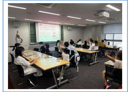
親子で体の仕組みについて学ぶ様子 (2023年度開催時の様子)

今回は、「簡易分光器を作ろう」「光のスペクトル」「電気を作ろう！①②」をテーマに、下記日程で開催します。ぜひ、ご取材ください。