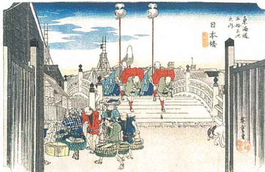
東海道五拾三次之内 日本橋 朝之景 (保永堂版)