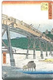
五十三次名所図会 世九岡崎 矢はき川やはきはし (縦絵東海道)