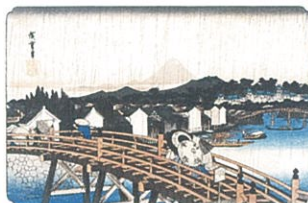
東都名所 日本橋之白雨