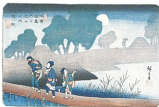
木曾海道六拾九次之内 宮ノ越