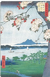
名所江戸百景 隅田川 水神の森真崎