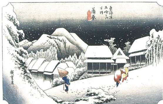
東海道五拾三次之内 蒲原 夜之雪 (保永堂版)