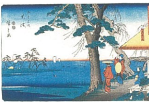
東海道 九 五十三次 大磯 (隸書版)