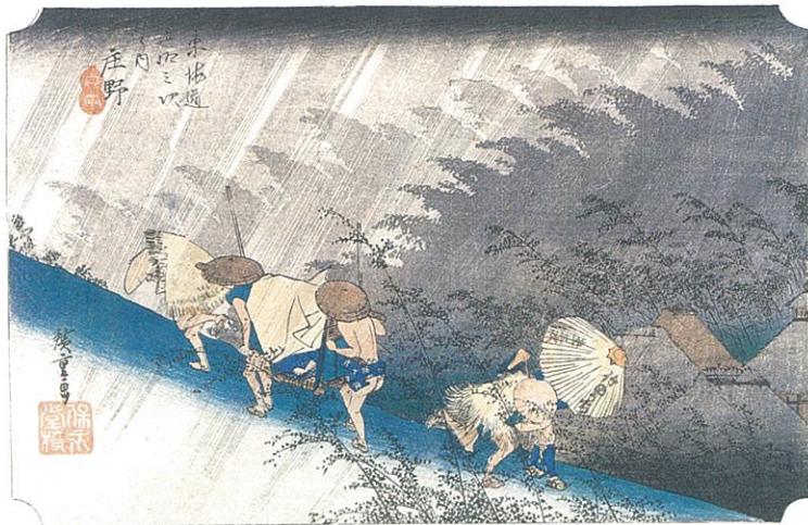
東海道五拾三次之内 庄野 白雨 (保永堂版)

風景画の名手歌川広重の代表作である保永堂版「東海道五拾三次之内」全55図に加え、行書版、隸書版、縦絵東海道などの各種東海道絵や、広重のもうひとつの代表的街道絵である「木曾海道六拾九次之内」から作品を紹介します。 また、江戸や近江などの名所絵もあわせて紹介し、広重の風景画の世界をすぐれた個人コレクションとともに堪能いただけます。