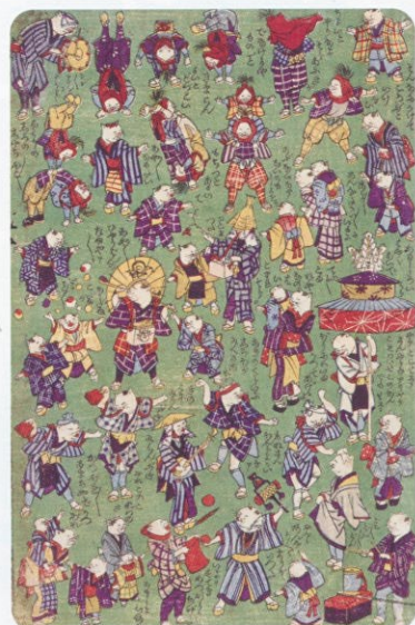
「新板猫のたわむれ」 幾英(機飛亭)画

雛祭りにちなみ、雛人形・雛道具をはじめ、抱き人形や手芸・動物など、世界を魅了する“Kawaii”品々を紹介します。