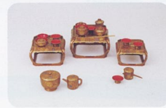
「鉄線唐草蒔絵雛道具 懸籠」