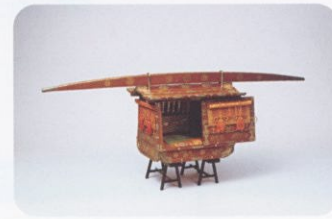
「菊折枝蒔絵雛道具 乗物」 俊徳院福君(尾張家11代齊温継室)所用