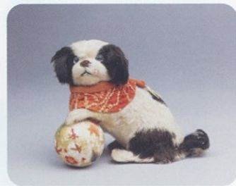
「毛植え人形 犬」 西光庵寄贈