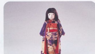
「市松人形」 瀧沢光龍斎作