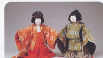
「御所人形(若君姫君)」