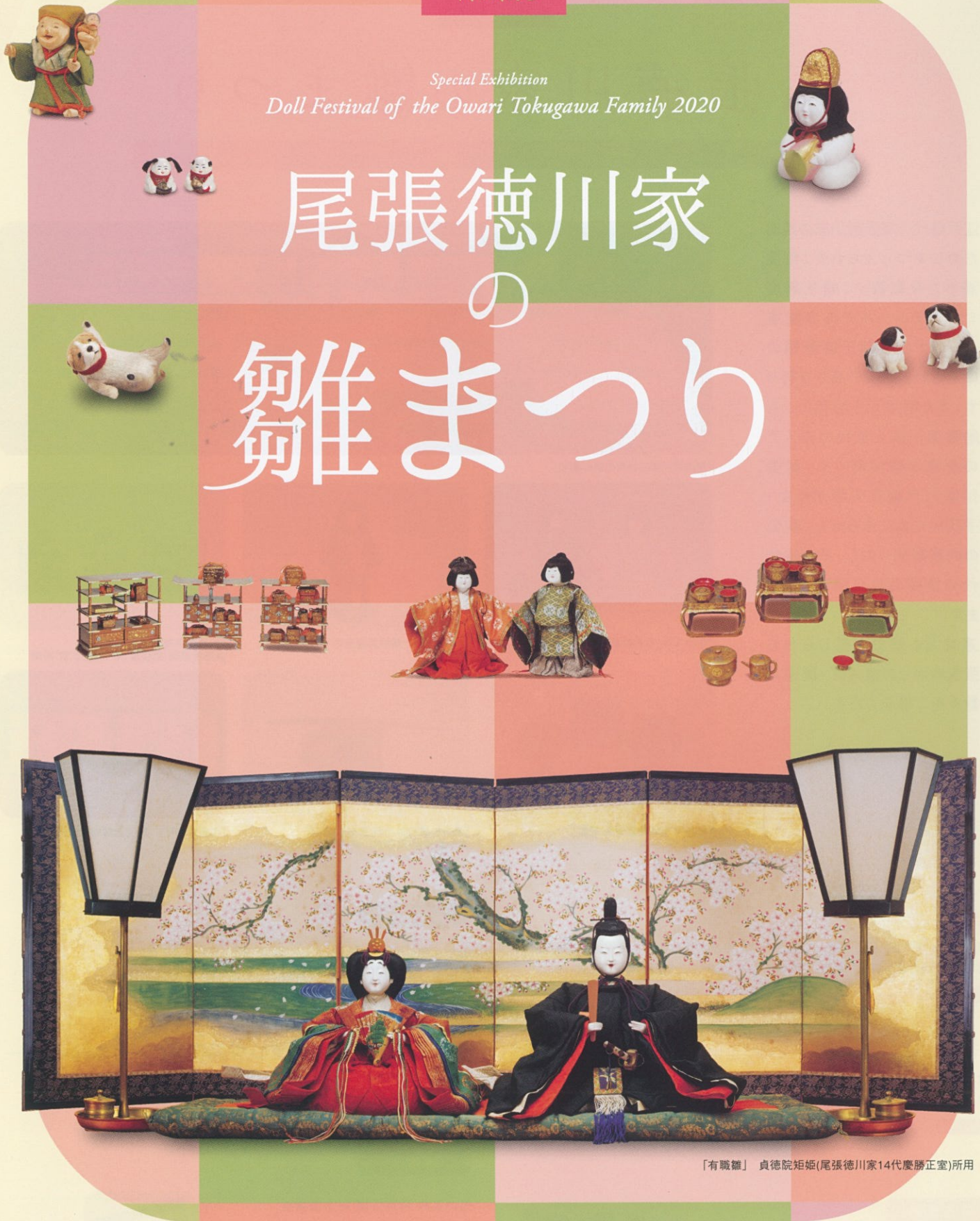
「有職雛」貞徳院姫(尾張徳川家14代慶勝正室)所用