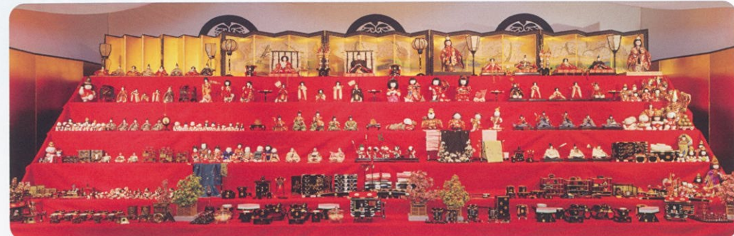
「尾張徳川家三世の雛段飾り」